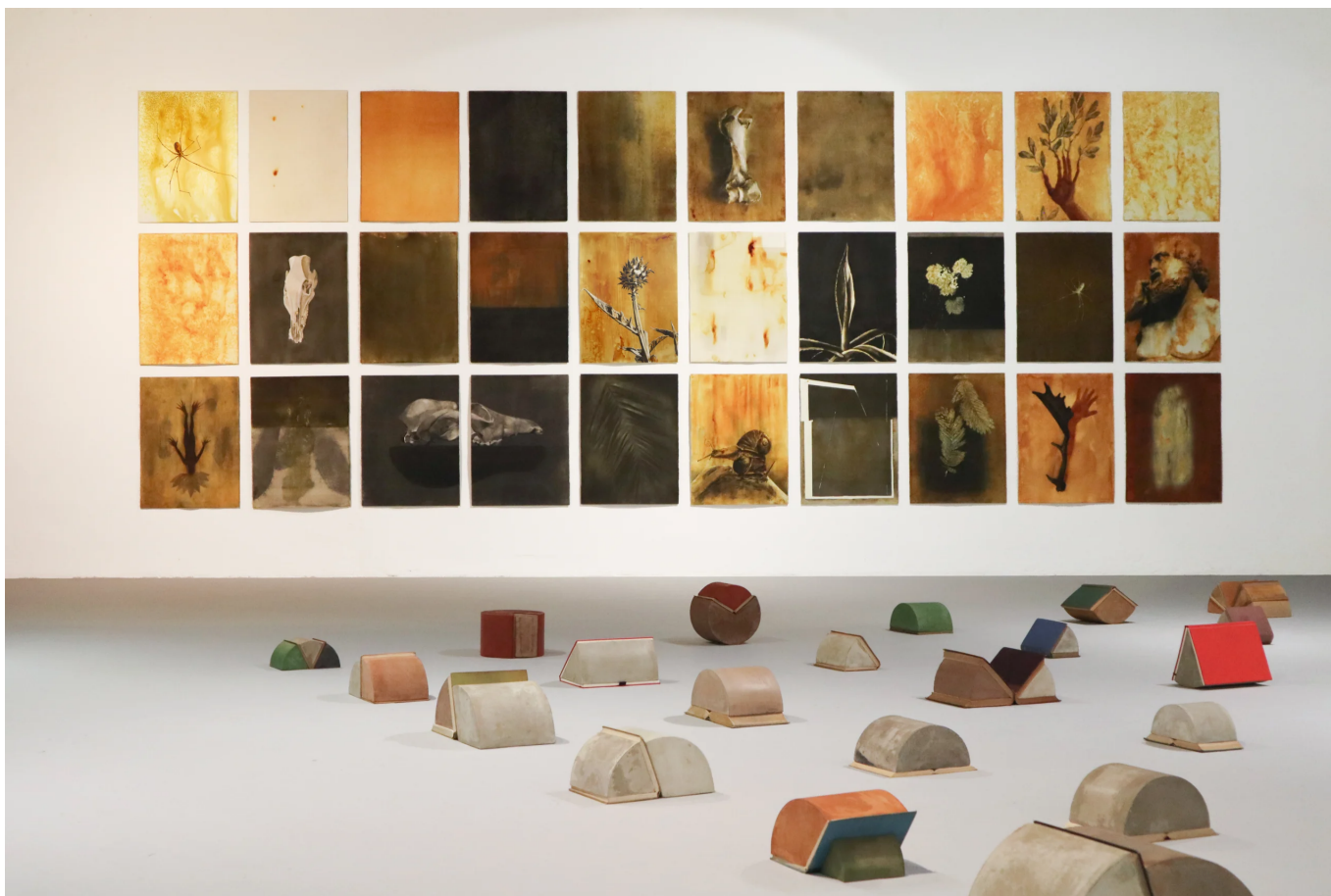
Al terra, en primer pla, una part de la sèrie de la Bibliogeometria. I a la paret els treballs sobre paper dels Naturalismes