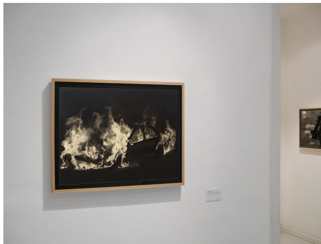
Un dels dibuixos exposats a la Galeria El quadern robat

La temàtica i el protagonisme principal d'aquesta sèrie de dibuixos intensos i obscurs a la vegada, són cotxes en flames, una de les imatges paradigmàtiques de tota mena d'accidents, de revoltes i de protestes. Són imatges que incideixen en la típica atracció-repulsió que ens provoquen les coses que es cremen, el foc, els objectes en flames. Les zones del dibuix on apareix el foc estan aconseguides a base d'esborrar i fer desaparèixer la negror del grafit, d'il·luminar l'obscuritat i deixar al descobert el color del paper de base. D'aquesta manera, Giró, com els pintors barrocs, cerca revelar la imatge, fer-la néixer, fer-la visible partint de la foscor. Potser per això titula aquesta sèrie Revelacions .