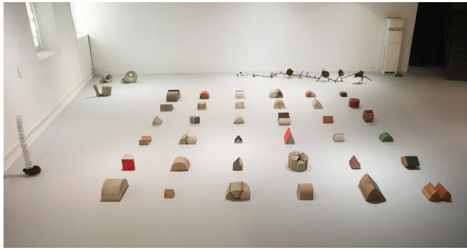
Vista general de les 36 peces de Bibliogeometria

Confrontada amb aquesta Bibliogeometria i ocupant tot un pany de paret, l'autor ha disposat una selecció de 30 dibuixos de la sèrie Naturalismes . En aquest cas es tracta de dibuixos acolorits sobre paper realitzats amb materials quotidians, pobres i senzills, com ara la cendra, el grafit, la tinta, el iode, o amb la participació d'elements naturals com la pols, la llum del sol o la humitat.