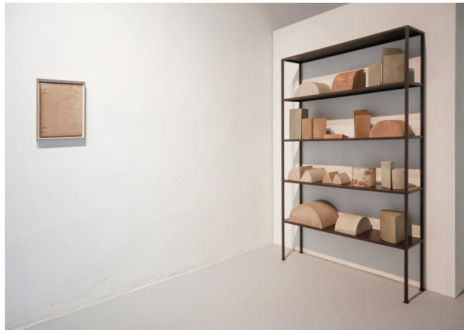
Imatge de la prestatgeria amb els Volums muts

Just a l'entrar, en un racó, trobem una prestatgeria de Volums muts . Es tracta d'una mena de biblioteca raconera, d'un expositor d'escultures minimalistes, d'una estanteria d'objectes, on s'exposen peces de dimensions més aviat reduïdes, de formes cilíndriques o de seccions de cilindres de diverses amplades i diferents alçades. Són peces compactes, opaques, fetes de formigó amb tonalitats grises i terroses, que converteixen en volums sòlids els espais buits interiors i les separacions entre pàgines de llibres que no hi són.